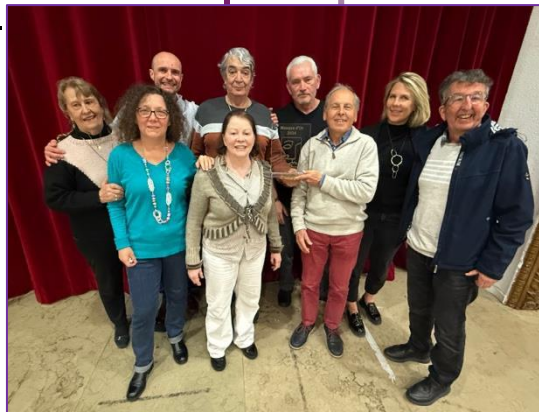
Les comédiens de Richard III dans leur salle de répétition à La Garde